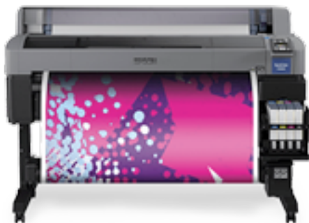
SURECOLOR SC-F6300 (HDK) 44 pouces

Gagnez du temps et de l'argent en produisant des vêtements de sport, de l'habillement, des objets promotionnels, des articles de signalétique souples, des accessoires et des gadgets de haute qualité sur tissus, vêtements et supports rigides. Tous les modèles de la gamme sont intégralement conçus et fabriqués par Epson, pour une fiabilité sans égal, un fonctionnement facile et un coût d'utilisation réduit. L'encre UltraChrome DS garantit des impressions éclatantes, tandis que la technologie avancée de nos têtes d'impression permet de limiter les temps d'arrêt et d'assurer une productivité maximale.