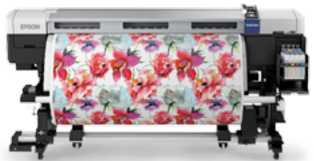
SURECOLOR SC-F7200 (HDK) 64 pouces

Produisez des textiles imprimés et des objets promotionnels de très grande qualité avec cette imprimante à sublimation à faible maintenance.