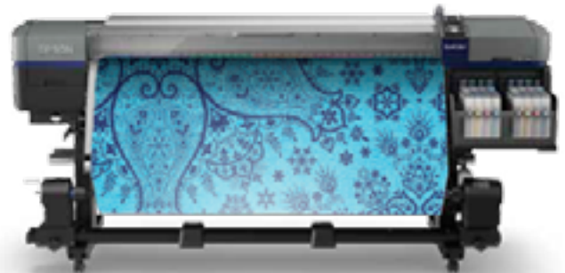
SURECOLOR SC-F9300 64 pouces

Epson dévoile sa première solution d'impression textile à sublimation et encres fluorescentes (jusqu'à 64 pouces/162,5cm).