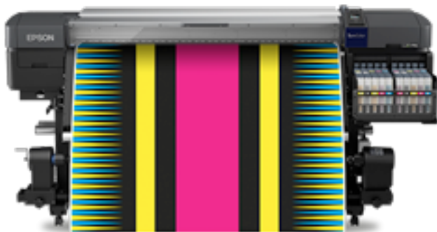
SURECOLOR SC-F9400H 64 pouces

Solution complète d'impression par sublimation pour la création de textiles de haute qualité.